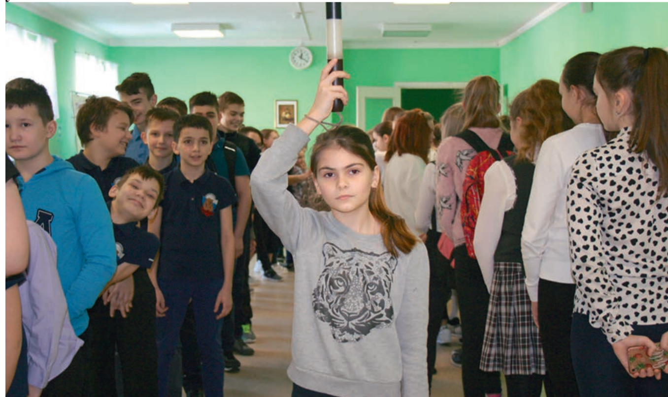
В школьных коридорах так тесно и шумно, что впору ставить регулировщика.

Пока нет второго корпуса школы, нам надо учиться жить в имеющихся условиях