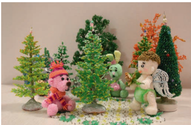
Фото: Григорий Михайлов / «Семьяя перемена». Мы объединили в одном пространстве изделия из бисера. Получилась сказка.

Девочки еще осознают, в какой мир входят. Бисероплетению почти шесть тысяч