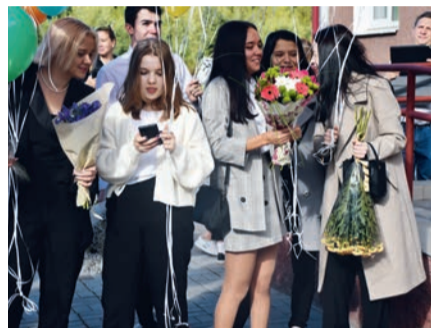
Фото: Григорий Михайлов / «Седьмая переменная». Одиннадцатиклассники.