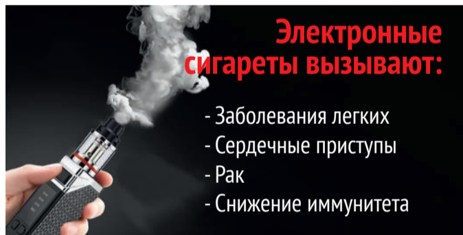
Инфографика: Станислав Райт / «Седьмая переменная».