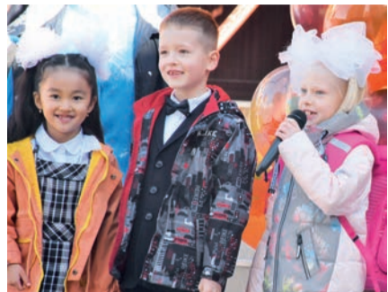
Фото: Григорий Михайлов / «Седьмая переменная». Первоклассники.

1 сентября Всеволожский центр образования распахнул двери для 250 первоклассников.