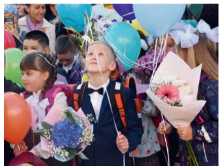
Фото: Григорий Михайлов / «Седьмая переменная». Полетим на седьмое небо!

Полетим на седьмое небо! Таким же разноцветным было в этот день и настроение первоклашек. В нем были и грусть расставания с детским садом и радостное волнение на пороге школьной жизни.