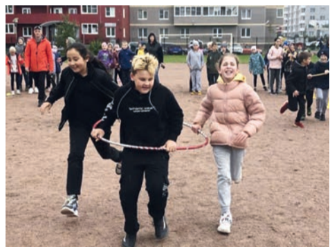
Азартная эстафета.

В пятницу, 17 сентября, команды учеников начальной школы состязались в эстафетах. Им не помешали ни дождь, ни ветер. Ребят поддерживали их семьи.