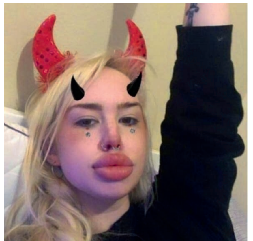
Некоторые девушки после пластики не прочь поиронизировать над собой.

не уколы. На чуть влажные пряди наносят сыворотку, отступая от корней и равномерно распределяя. После этой процедуры волосы становятся гладкими и блестящими.