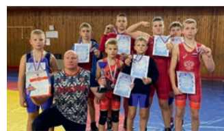
Победители и призеры областного первенства.

Газета МОУ «Всеволожский ЦО» и микрорайона Южный Адрес редакции: 188643, Ленинградская область, г. Всеволожск, микрорайон Южный, ул. Невская, д. 10. Электронная почта: s7peremena@yandex.ru Тел.: 8-903-097-39-65. Газету подготовили участники Молодежного объединения журналистов «Седьмая переменная» МОУ «Всеволожский ЦО» Газета сверстана и отпечатана в типографии ООО «Цифра он-лайн» Адрес: 192171, г. Санкт-Петербург, ул. Бабушкина, 36/1. Печать офсетная. Тираж: 999 экз. Дата выхода в свет: 30 сентября 2021 года.