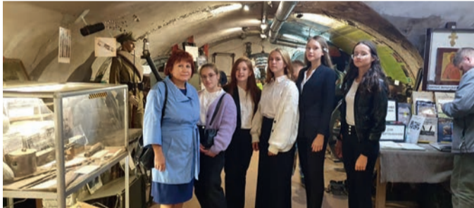
Представители ВЦО в музее форты Красная горка.

Ученики ВЦО участвовали в открытии памятника Таллинскому переходу в форте Красная горка (Ломоносовский район).